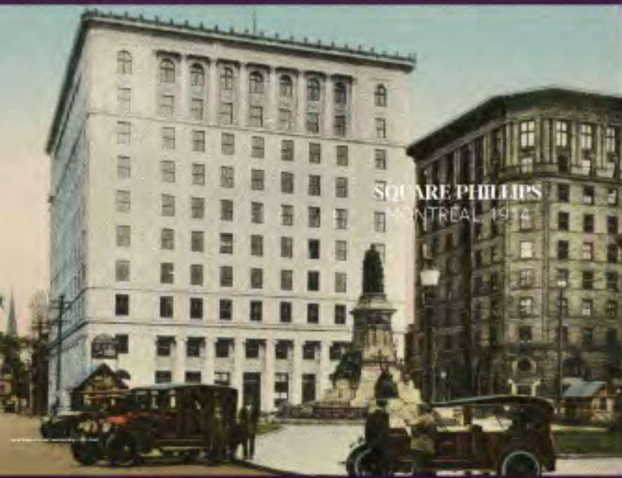
SQUARE PHILLIPS MONTREAL, 1917